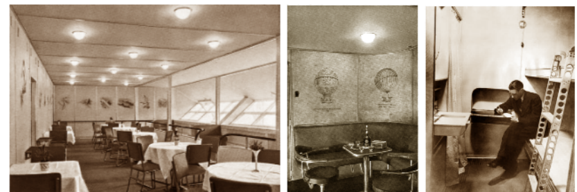
Speisesaal Dining Room